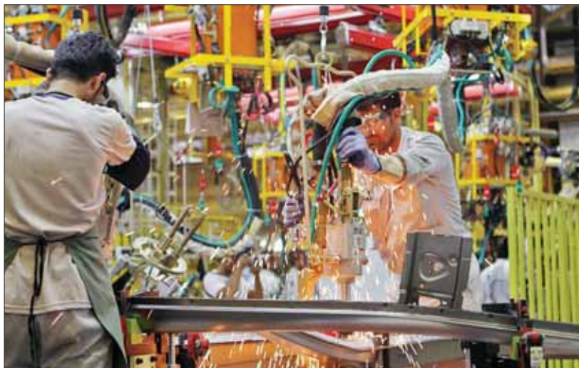
هدف اصلی این طرح نه تنها ساماندهی بازار خودرو، بلکه همه بخش‌های این صنعت از جمله قطعه‌سازی، تولید، فروش، تحویل و خدمات پس از فروش است

مآزاد درآمد خودروسازان پس از تغییر روش قیمت‌گذاری، به صندوق تسهیلات صنعت خودرو در وزارت صمت واریز خواهد شد