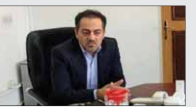
معماری باشی معماری باشی

موجود در پارکینگ ها مشخص بوده و تعداد خودروهای ناقص بالغ بر ۱۰۰ هزار دستگاه است که در پارکینگ خودروسازان قرار دارند. این قطعات وارداتی هستند و دلایل عدم تأمین و ترخیص به موقع آن ها تا حدود زیادی مشخص است و گمرک جمهوری اسلامی و همچنین بانک مرکزی و سایر دستگاه های مرتبط از شرایط این موضوع به طور کامل آگاهی داشته و مطلع هستند.» معمارباشی افزود: «بهردم عزیز کشورمان