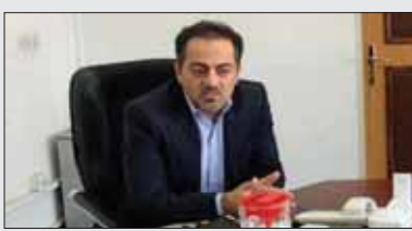
معماری باشی معماری باشی

موجود در پارکینگ ها مشخص بوده و تعداد خودروهای ناقص بالغ بر ۱۰۰ هزار دستگاه است که در پارکینگ خودروسازان قرار دارند. این قطعات وارداتی هستند و دلایل عدم تأمین و ترخیص به موقع آن ها تا حدود زیادی مشخص است و گمرک جمهوری اسلامی و همچنین بانک مرکزی و سایر دستگاه های مرتبط از شرایط این موضوع به طور کامل آگاهی داشته و مطلع هستند.» معمارباشی افزود: «بهردم عزیز کشورمان