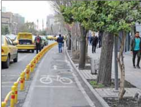
شهرداری تهران کمک‌کنند و تسهیلات لازم برای خرید دوچرخه برقی توسط دولت به شهروندان ارائه شود.

معاون شهردار تهران ضمن اشاره به نبود سابقه تاریخی برای ایجاد و ساخت مسیر دوچرخه با چنین عدد بزرگی در تهران ادامه داد: «استفاده از دوچرخه به عنوان یک وسیله تفریحی در قالب یک مد ترافیکی در برنامه‌های شهرداری دیده شده است. البته مشکلات بسیاری اعم از ترافیک معابر، تقاطع‌ها، نبود کریدورهای متصل به ۲۲ منطقه و بزرگراه‌ها برای توسعه مسیر دوچرخه سواری وجود دارد. همچنین ایجاد تعدادی کریدور در دستور کار معاون حمل‌ونقل و ترافیک شهرداری قرار گرفته است.» به گفته وی دولت و بانک‌ها برای توسعه دوچرخه‌سواری در پایتخت باید به