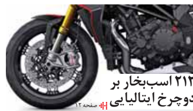
۲۱۲ اسب بخار بر دوچرخ ایتالیایی