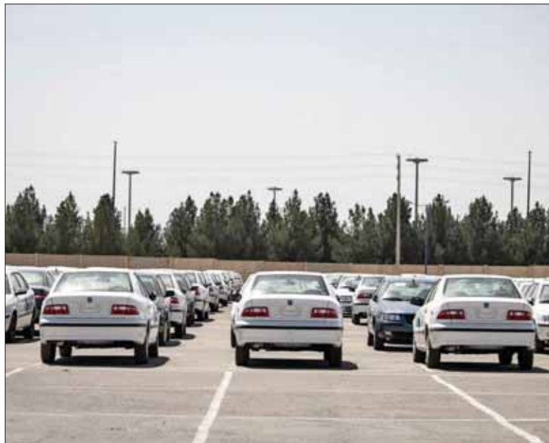
عسکر، خبرگزاری مهر

مقیمی از بابت این که این خودروها با قیمت‌های تعیین شده به مشتریان تحویل می‌شود نیز خیال مشتریان را راحت کرده و گفته است: «با گذشت زمان قیمت آن‌ها افزایش خواهد یافت.»