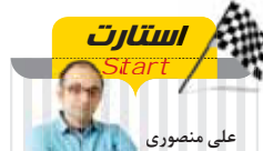
عضو شورای سردبیری