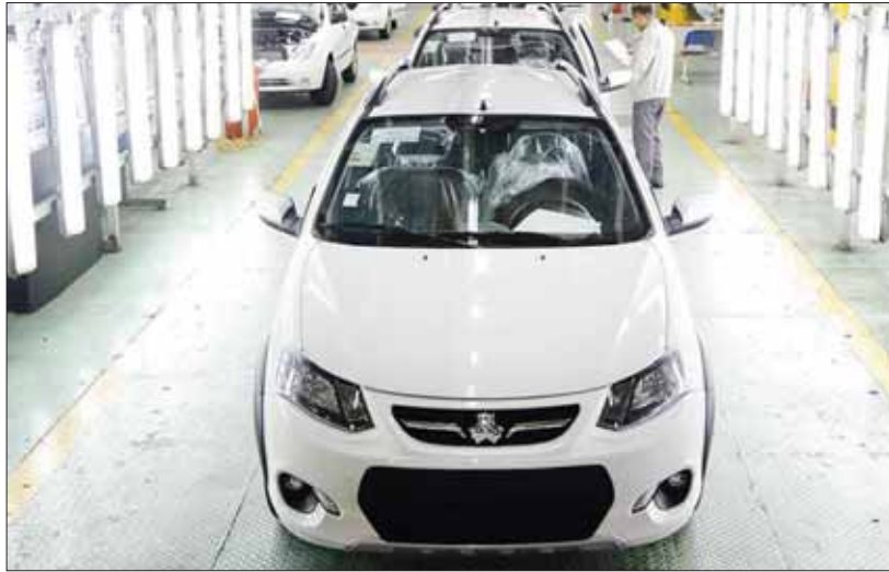
تعهدات معوق گروه خودروسازی سایپا در بیستم تیرماه سال ۹۸ بیش از ۲۹۲ هزار دستگاه انواع خودرو بوده که این عدد در بیستم تیرماه ۹۹ به حدود ۷۶ هزار دستگاه خودرو کاهش پیدا کرده است

تخصیص تولیدات فصل بهار به تعهدات معوق گروه خودروسازی سایپا در گذشته برای تولید محصولات خود بیشترین وابستگی را به شرکای خارجی داشت، به گونه ای که بیش از ۱۰۰ هزار دستگاه خودرو مشترک با شرکت های چینی و فرانسوی تولید می کرد، اما در سال ۹۸ و با اجرای پوی ملی بومی سازی قطعات، این وابستگی را به صفر رساند و موفق شد کاهش تولید خودروهای مشترک را با محصولات داخلی جبران کند. مدیرعامل گروه خودروسازی سایپا در این باره می گوید: «سایپا در سال گذشته با اجرای پوی ملی ساخت بومی سازی قطعات خودرو، موفق شد ضمن تعمیق ساخت داخل ادامه در همین صفحه