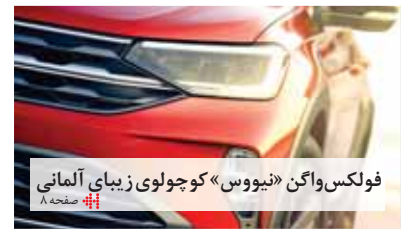
فولکس واگن «نیووس» کوچولوی زیبای آلمانی ۸ صفحه

عضو هیات‌مدیره انجمن صنایع همگن قطعه‌سازان در گفت‌وگو با «دنیای خودرو»: