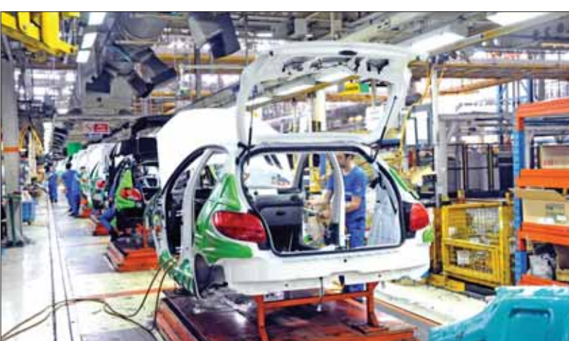
توسعه فرمان برقی روی محصولات خانواده ۲۰۷ و دنا پلاس نیز از برنامه‌های سال جاری است که موجب بهینه‌سازی مصرف سوخت و افزایش راحتی و ایمنی خودرو می‌شود

گروه صنعتی ایران خودرو برای سال جاری در حوزه تدوین نقشه راه قوای محرکه، راه‌حل‌های کوتاه‌مدت، میان‌مدت و بلندمدت تعریف کرده است. کاهش شمارگان موتورهای ادامه در همین صفحه