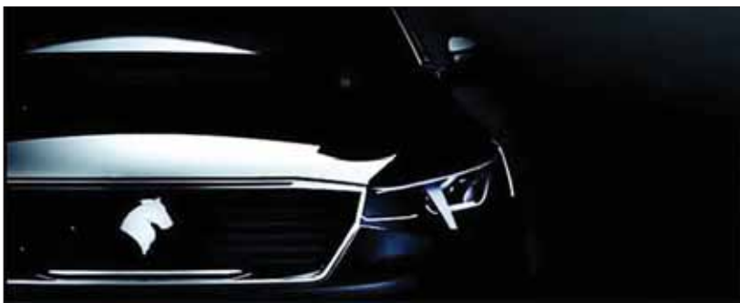
بدنه این خودرو در سالن بدنه‌سازی مدرن و جدیدی که پیش از این خط تولید بدنه ۲۰۰۸ بود، به تولید خواهد رسید. این خط دارای سیستم اتوماسیون بالا و بسیار مدرن است

برنامه دقیق برای جهش ۷.۵ برابری تولید در حال حاضر سالن مونتاژ این خودرو در حال آماده‌سازی و اعمال تغییرات لازم و مطابق سازی با پروژه جدید است. بدنه آماده‌شده فلزی نیز به همراه قسمت‌هایی از مواد کامپوزیتی از خط مونتاژ عبور کرده و با استفاده از