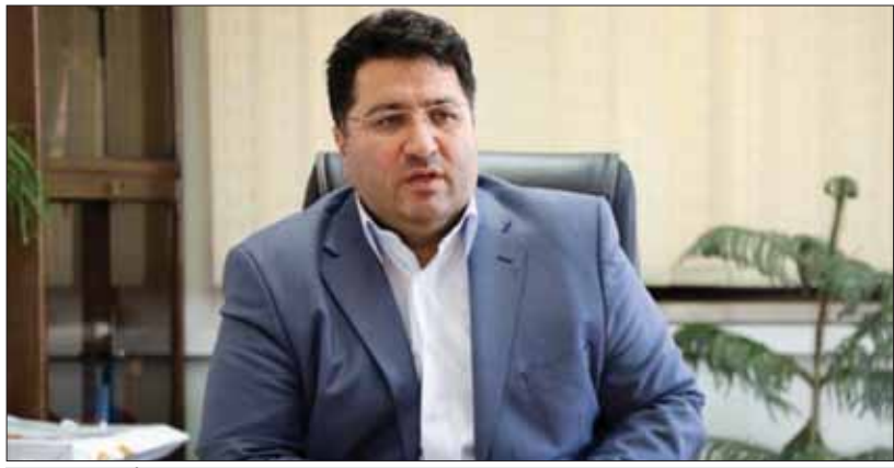
پیشنهاد سازمان حمایت این بود که ۱۰ درصد بالای قیمت مصوب خودرو به‌عنوان منشأ تعزیر در نظر گرفته شود، این موضوع در کمیته‌های مربوط در دست بررسی است

وی از دیدگاه‌های متفاوت موجود در این زمینه خبر داد و افزود: «برخی می‌گویند وقتی قیمت مصوب برای خودرو وجود دارد یا خیر تصریح کرد: «قیمتی که شورای رقابت