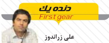
زنده یک First gear