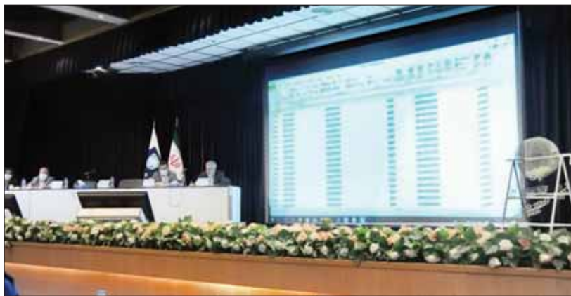
این قرعه‌کشی با ۱۰ درصد بیش از ظرفیت پذیرفته‌شدگان انجام می‌شود تا امکان جایگزین کردن افراد رزرو با افرادی که ظرف ۸ ساعت موفق به پرداخت وجه خودرو نشده‌اند، فراهم باشد

صبح امروز بر اساس اطلاعات متقاضیانی که مورد راستی‌آزمایی قرار گرفته و در سامانه ثبت شده است، مراسم قرعه‌کشی انجام می‌شود و تعداد ۱۵ هزار برنده برگزیده و معرفی خواهند شد. پس از اتمام مراسم قرعه‌کشی و تایید نهایی توسط ناظران نیز اسامی برندگان از طریق ارسال پیامک و همچنین سایت فروش ایران خودرو به‌نشانی esale.ikco.ir اطلاع‌رسانی خواهد شد. این قرعه‌کشی با ۱۰ درصد بیشتر از ظرفیت ادامه در همین صفحه