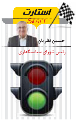
حسین نظریان رئیس شورای سیاستگذاری

گفته می‌شود که قرار است از محل صندوق توسعه ملی مبلغ یک میلیارد دلار در اختیار صنعت خودرو جهت حل نسبی مشکلات آن قرار گیرد و باز هم گفته می‌شود مبلغ مذکور از طریق خودروسازان به‌قطعه‌سازان به‌منظور تادیه بخشی از بدهی‌های چنددهه هزار میلیارد تومانی آن‌ها داده شود. در دوسه‌سال اخیر میزان بدهی خودروسازان به‌قطعه‌سازان از ۳۰ هزار میلیارد تومان عبور کرد و قطعه‌سازان به‌شدت در تنگنای نقدینگی قرار گرفتند؛ به‌گونه‌ای که از یک‌هزار و ۲۰۰ قطعه‌ساز ۴۰۰ قطعه‌ساز در معرض تعطیلی یا نیمه‌تعطیلی قرار گرفتند و