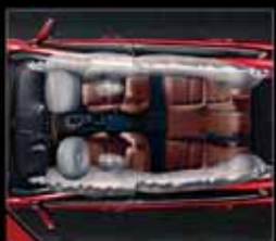
دارای ۶ کیسه های ایمنی برای سرنشینان جلو و عقب