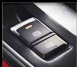
ترمز پارک برقی و سیستم نگهدارنده خودکار AUTO HOLD