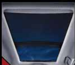
سقف پانورامیک چهار حالت با روکش برقی