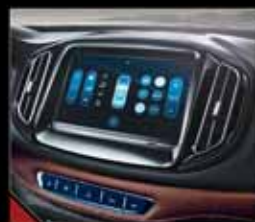
مانیتور ۹ اینچ تلم لمسی چند منظوره