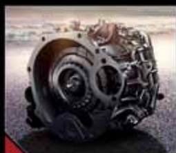
گیربکس دو کلاچه ۶ سرعته طراحی شرکت گنراک آلمان