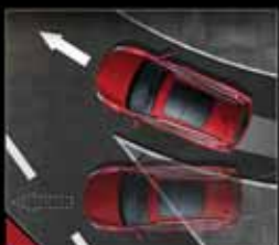
سیستم پایداری الکترونیکی ESP سیستم هرزگردی TCS