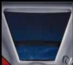
سقف پانورامیک چهار حالت با روکش برقی