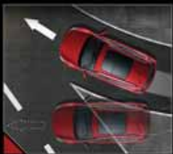
سیستم پایداری الکترونیکی ESP سیستم هرزگردی TCS سیستم کنترل خودرو در سرعتهای و سرپایینی