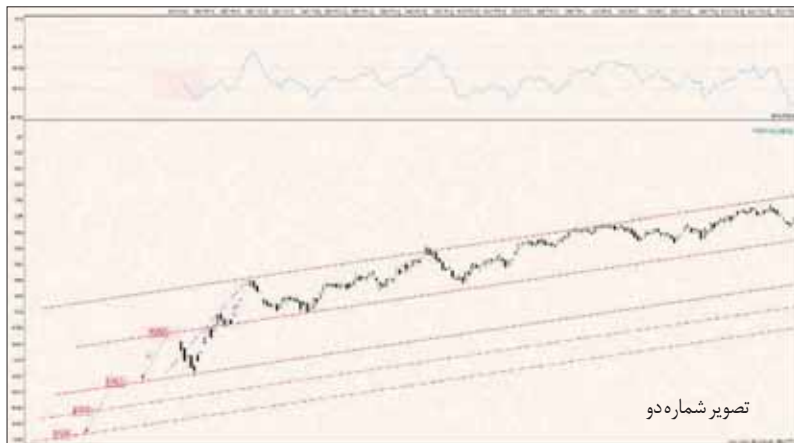
تصویر شماره دو

رشد و بازدهی بازار سرمایه از بازارهای رقیب که رکود در آن‌ها حکم فرماست، بسیار مطلوب‌تر بوده است