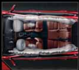
دارای ۶ کیسه‌های ایمنی برای سرنشینان جلو و عقب