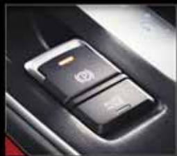
ترمز پارک برقی و سیستم نگهدارنده خودکار AUTO HOLD