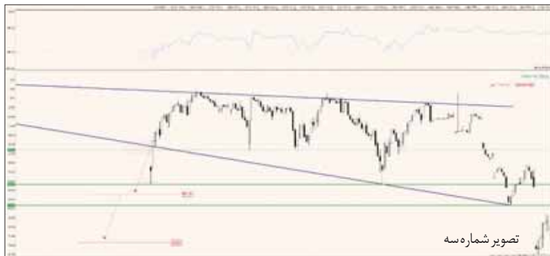
تصویر شماره سه

سایر شرکت‌های مورد نظرش نیاز به نزدیک شدن قیمت تا بلو معاملات با قیمت مورد نظر را دارد که این امر تا حد زیادی محقق شده و موجب رشد چندصد درصدی سهام شرکت‌های صنعت خودرو در سال جاری شد. البته صنایع دیگری هم مشابه این رشد‌ها را در بورس تجربه کرده‌اند، اما تمرکز ما در این مقال صنعت خودرو است؛ صنعتی حساس در کشور با اشتغال بسیار بالا که پس از دهه‌ها تصمیم به خصوصی‌سازی واقعی آن‌ها گرفته شده است. انصافاً بازار سرمایه هم نگاه ویژه‌ای به این صنعت دارد و معمولاً معاملات آن‌ها توسط اغلب فعالان بازار سرمایه دنبال می‌شود و سیگنال‌های خاص در خصوص جو بازار صادر می‌کند. البته وضعیت مالی این شرکت‌ها به‌جز مددودی از قطعه‌سازان زیرمجموعه، شرایط مطلوبی ندارد و با زیان‌های گسترده‌ای طی سال‌های اخیر همراه بوده که علت اصلی آن هزینه‌های مالی هنگفتی است که کم‌ر این صنعت را خیم کرده است. طبعاً یک بخش خصوصی قدرتمند و پویا می‌تواند این شرکت‌ها را به ریل سودسازی بازگرداند؛ اتفاقی که در شرکت‌های مشابه که پیش‌تر به بخش خصوصی قوی واگذار شده است، شاهد بودیم و گروه بهمن مثال خوبی از این‌گونه است.