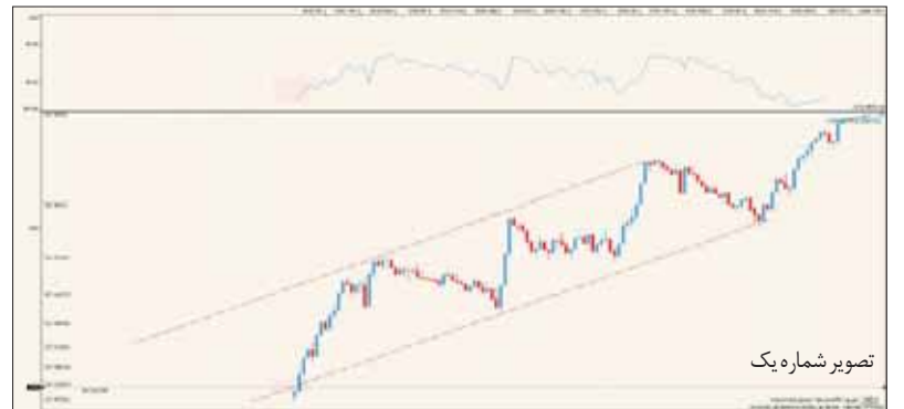
تصویر شماره یک

بازار سرمایه ماه‌هاست گوی سبقت را از سایر بازارهای رقیب رفته و در صدر اخبار اقتصادی قرار گرفته و رکورد بیشترین بازدهی‌ها را به‌نام خود ثبت کرده، این در حالی است که در بازارهای رقیب خبری از رشد و بازدهی مطلوب نیست و رکود حکم فرماست. البته بحث بازار رقیب به‌صورتی که ما از آن یاد می‌کنیم و بازار خودرو و مسکن و سود بانکی را مورد نظر داریم، بیشتر مخصوص ایران است. در اقتصادهای پیشرفته اساساً خودرو و مسکن کالای سرمایه‌ای محسوب نمی‌شود و با ایجاد شرایط و مقررات مختلف از جمله قوانین مالیاتی سعی در مهار سفته‌بازی در بازارهای ملک و خودرو می‌شود. چراکه مستقیماً با معاش مردم سرو کار دارد و البته بازار پول و بحث نرخ سود بانکی یک ابزار کنترلی برای مدیریت اقتصادی بوده که به اقتضای شرایط با رشد و کاهش همراه است.