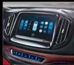
مانیتور ۹ اینچ تعامل لمسی چند منظوره