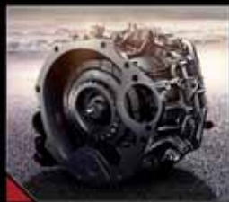
گیربکس دو کلاجه ۶ سرعته طراحی شرکت گدراک آلمان