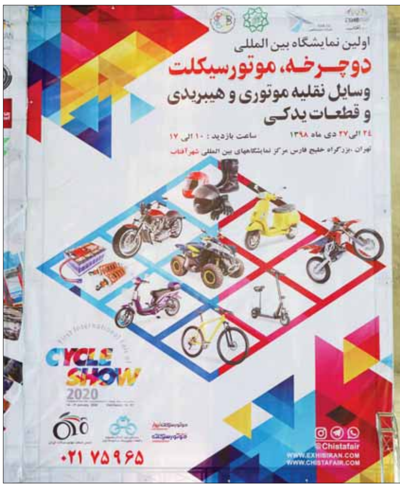
پوستر نخستین نمایشگاه سایکل شو در محل برگزاری نمایشگاه های شهر آفتاب